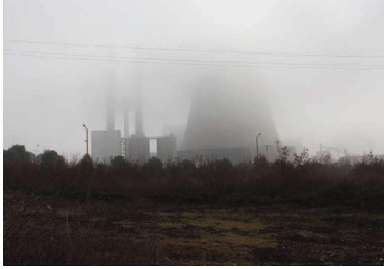
Çan'daki Termik Güç Santrali

Bu araştırma, Çanakkale'nin Çan bölgesindeki kömürlü termik santrallerin yerel kadınların günlük rutinlerini nasıl etkilediğini anlamayı amaçlıyor. Termik santral inşaatlarına ve çevreye zarar veren diğer projelere rağmen kadınların ihtiyaçlarını ve görmek istedikleri toplumun dinamiklerini saptamaya çalışıyor. Bu çalışmada güncel literatür çalışmaları (akademik yayınlar, sivil toplum raporları), röportajlar ve konuyla ilgili ek bilgi yöntemleri (belgeseller, basın makaleleri vb.) kullanıldı. Saha çalışmasına ek olarak kasabada yaşayan kadınlarla derinlemesine görüşmeler yapıldı.